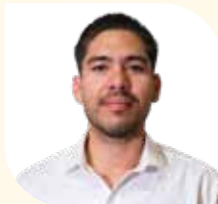
Director Municipal de Gestión y Normatividad Ambiental