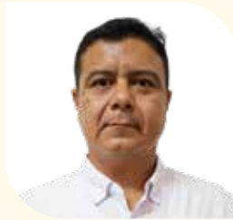
Encargado de Despacho de la Dirección Municipal de Pesca y Acuicultura