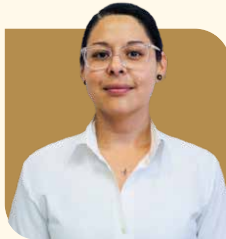
Delegada Municipal de La Ribera