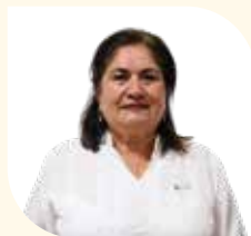
Directora Municipal de Educación