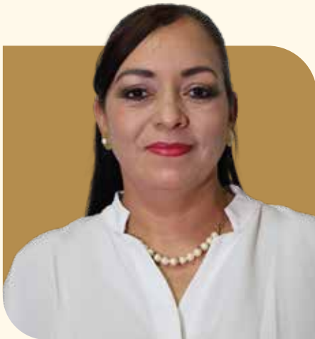
Delegada Municipal de Santiago