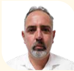
Director Municipal de Desarrollo Rural