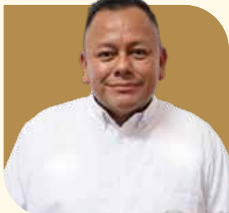
Director General de Planeación y Desarrollo Urbano