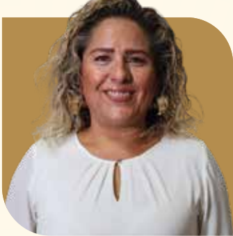
Directora General de Fomento Económico