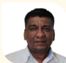
Encargado de Despacho de la Dirección Municipal de Recursos Naturales y Vida Silvestre