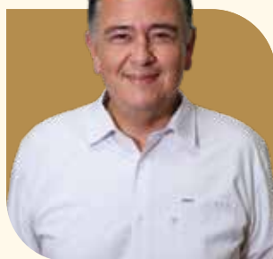
Director General de Desarrollo Social