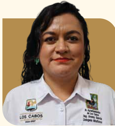
Delegada Municipal de Miraflores