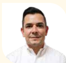
Director Municipal de Inversiones y Programas Federales y Estatales