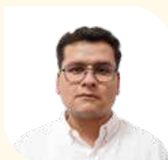
Director Municipal de Imagen Urbana