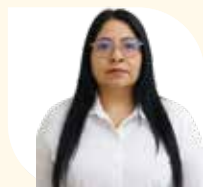
Procuradora del Sistema Integral para el Desarrollo de la Familia Rocío Guevara Domínguez