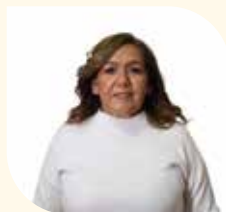
Directora Municipal de Organización y Participación Ciudadana