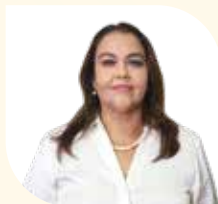
Directora Municipal de Educación, Divulgación y Promoción Ambiental