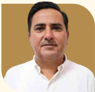
Encargado de Despacho de la Dirección General de Ecología y Medio Ambiente