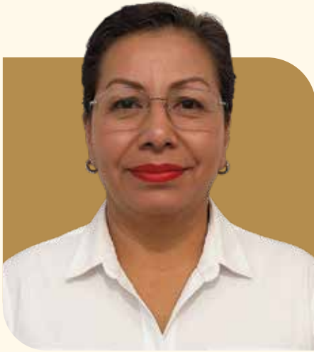
Delegada Municipal de Cabo San Lucas