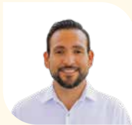
Encargado de Despacho de la Dirección Municipal de Vinculación y Fomento de Empresas