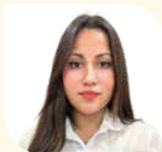
Directora Municipal de Licencia de Construcción