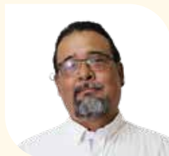
Director Municipal de Planeación Urbana